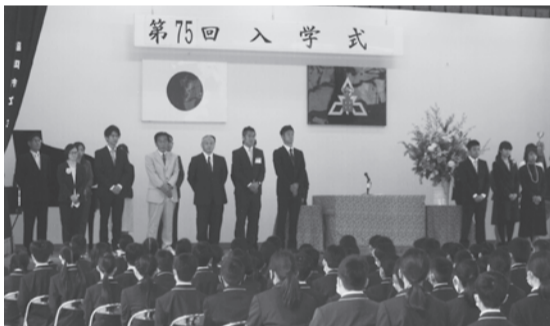
▲先生方との対面する新入生達!!

範囲内? 駅前の旧道で車と接触した。 海から海岸にあがってきたところを見た人がいる(もしかするとクロススカントリ)