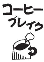
コーヒーブレイク

めぐりで一向に進まない。正に道に迷った感覚。同じ所を何度も通り過ぎていく状態だ。結局、息子に泣きつく事になった。トントンとしてもアドレス出てこんよと聞くと「そもそもコピーしてないやん」と呆れ顔だ。そのコピーは、どうするんだ。途中で違う画面にしたから、元の画面に戻れなくなると聞くと「スクショすればいいやん」と溜息。だからスクショして何。どうしたらいいんですか。隣で見ていた旦那が、大ごとやわと苦笑いしている。諦めた息子は私の携帯を手に「こ