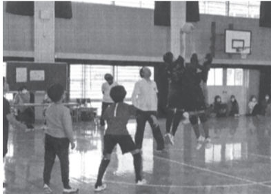
▲体育館でプレーを楽しむ子ども達

最後にいった男子対女子との対戦が一番盛り上がったように思います。子ども達の楽しそうなお顔を、深い勝敗めめ楽しそうに笑顔をみせてくれました。