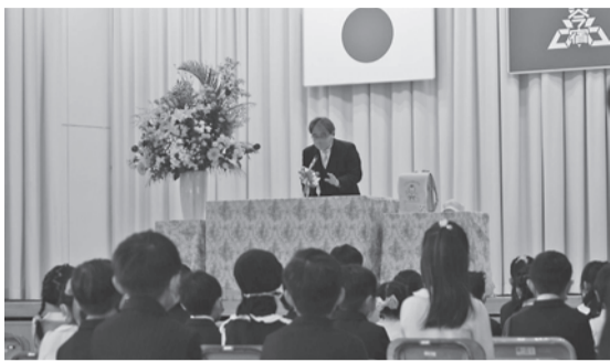
▲緊張した面持ちで校長先生のお話に聞き入る新1年生(今宿小)