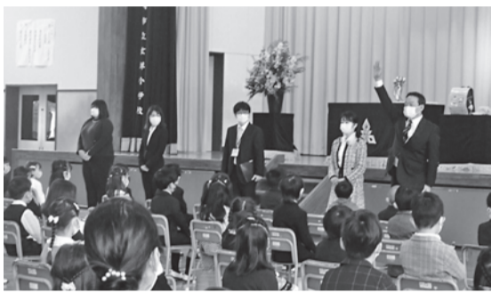
▲新しい先生との対面に「わくわく、ドキドキ」の子ども達!(玄洋小)