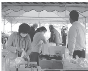
▲活動中のボランティアの方々!!

子どもの健全育成や子育て世帯支援の一環として留守家庭子ども会の子どもに夕食の提供を行い、保護者の支援を図る今宿版の「子ども食堂」をめざす事業です。コロナ禍のため昨年10月に続いて、今回もティークアウト形式の実施です。