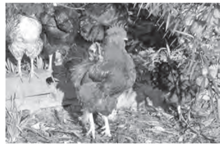
▲柿の実を食べていたニワトリ