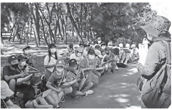
▲元寇防塁史跡で説明を聞く子ども達

対象は5年生。4クラス136名を①元寇防塁コース、②大塚古墳コース、③唐津街道コースの3グループに分け、それぞれのコースを入れ替えて3回(3日)に分けて