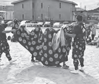
▲今宿青木獅子舞を熱心に見つめる子ども達