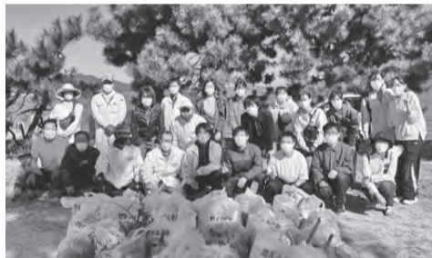
▲ビーチクリーンに参加したボランティアの方々

ご芳志の御礼 故人やご遺族のご意志にそい、校区の福祉事業の浄財として有意義に活用させていただきます。