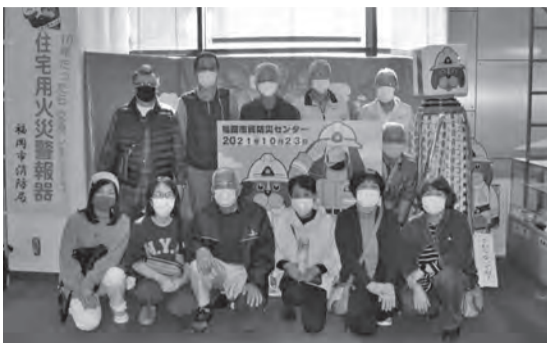
▲防災センターで記念写真をパチリ!!

命を失う原因の第一が一酸化炭素中毒であり、煙の温度が500℃、600℃の高温となり肺や気管などを火傷すること。そのため煙を吸わずに安全に脱出するために鼻や口を布や上着