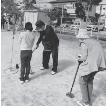
▲亀齢会の人に教ををう子ども会会員

「嵐」に興味のある方もそうではない状況でした。反省会では①いい体験のあることを紹介しても良かった。②災害についての様々な情報を知ることができたので、多くの人が体験した方がいい、という意見が多く出ました。福岡防災センターは団体でも個人でも受け付けてくれるそうです。一度体験されては如何でしょうか。