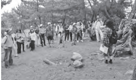
▲平成28年8月の『嵐ウォーク』の様子

「嵐」に興味のある方もそうではない状況でした。反省会では①いい体験のあることを紹介しても良かった。②災害についての様々な情報を知ることができたので、多くの人が体験した方がいい、という意見が多く出ました。福岡防災センターは団体でも個人でも受け付けてくれるそうです。一度体験されては如何でしょうか。