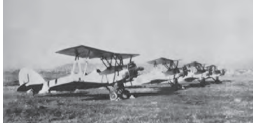
▲ 九五式三型初歩練習機 (元岡にて)