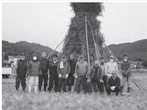
▲ほうげんぎょうのやぐらと堀ノ内発展会の方々

1月7日、今宿上ノ原堀ノ内で、ほうげんぎょうが行われました。ほうげんぎょうは、無病息災を願う伝統行事で、農家にとっては仕事始めでもあります。年男が火を点けるといい年になるので、次に繋がる若い人材が加わり益々広い分野での活躍を期待する事ができるでしょう。 1月7日、今宿上ノ原堀ノ内で、ほうげんぎょうが行われました。ほうげんぎょうは、無病息災を願う伝統行事で、農家にとっては仕事始めでもあります。年男が火を点けるといい年になるので、次に繋がる若い人材が加わり益々広い分野での活躍を期待する事ができるでしょう。