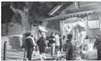
▲横町祇園神社の参拝

新型コロナウイルス感染症オミクロン株感染が心配される中で迎えた2022年は、晴天で光輝く正月を迎えることができました。今年も「お正月を写そう2022年」と、神社(祇園神社・二宮神社・熊野神社・上町天満宮・出雲大社福岡分院・植安神社・叶嶽神社・八雲神社)の初詣と新年行事詣を行いました。 今年「虎年」。虎は千里を走ると言われています。今年「虎年」に満ちた行動をしよう」と元氣よくいざ出発!元日前15分に横町祇園神社に出かけました。神社では、お神酒は紙コップ、イカと昆布はフラスナー付きポリ袋に入れてコロナ対策