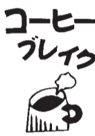
コーヒーブレック

のセイルがついた初心者用のボードを抱えている。全くと沖に向かって動き出した。ボード上でセイルを持ち上げる事に成功。かすかに風を捉え、ボードはゆっくりと波を乗り越えていく。決して格好いい姿勢ではなかったが、ボードの上で、必死にセイルを操作している。10メートルくらい走ったところで、彼女はバランス