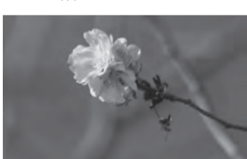
▲新年を祝うさくらの花

山上空にほとんど雲がなく7時43分に頭を出した太陽は、まぶしく光り輝いていました。多くの方が来光をスマホでパチリ。ひと段落ちた8時30分に次の目的地へ出発。上町天満宮は、鳥居の柱と額東の間に太陽が光輝いていました。写真撮った後、出雲大社福岡分院へ。おみくじの願い事には、「人をうやまいて対応すれば叶って喜びあり」とうれしい言葉が書いてありました。次に植安神社でお参りをした。八雲神社で2年ぶりの元日の獅子舞奉納と元日の参拝を終え、帰宅の途に最高能島から福岡市内や青い海が一望できました。階段を登って叶嶽神社に着くと、東側の木より光り輝く太陽が本殿を照らしていました。パチリと写真