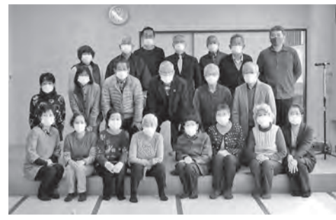
▲マスク下は皆さん笑顔(^^)です!!

開催するにあたって、当日は始まる前に検温・消毒を参加者全員に実施しました。始まってからは座席でのソーシャルディスタンス、マスクを着用しての会話、出し物を減らしての時間短縮など協力を仰ぎ、コロナ