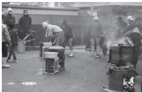
▲横町町内の餅つき大会

4台の蒸し器を使用しても時間が掛かりました。餅こね器でこねた後、杵でつき、ついた餅の一部を民生委員さんが高齢者宅へ配布しました。お届けした皆さんからは喜んで頂けたとのこと。また会場では餅の販売と一緒に注連縄やミニ門松の販売も行いました。 午後2時には子ども会育成会も集合して子ども達が餅つきや餅の手もみ体験して餅つき大会を楽しみました。この餅つきで横町と横浜西町内で高齢者約百世帯に餅が配布され