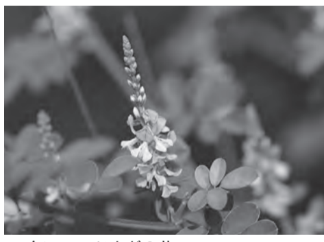
▲白いコマツナギの花

濃さや重ね塗りなどして作品を作っていました。暑い中でスケッチ大会のために、色塗りは冷房の効いた1階講堂で行ったり、途中にアイスのプレゼントがあったりの心づかいもありました。12時にスケッチ大会は終了しました。参加者からは「また公民館に来てスケッチをしたいですか？」という嬉しい感想も数多く頂きました。美しい景観の玄洋公民館は、来館者をお待ちしています。