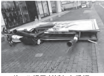
▲ポール根元が折れた看板