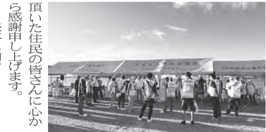
▲皆様のご協力で盛大な花火大会(上写真)が開催できました。感謝!!