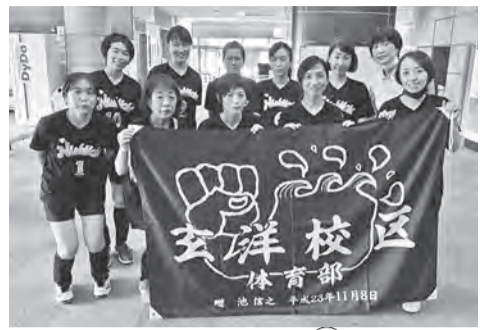
爽やかな汗をかきました