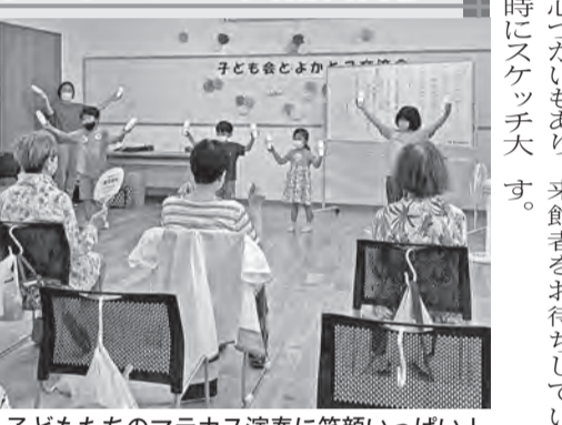
▲子どもたちのマカス演奏に笑顔いっぱい!

8月20日(土)、上町公民館で上町ふれあいサロンの形で行われた「お手玉的当てゲーム」、「ジェスチャーゲーム」では大人も子どもも大盛り上がり。次に子ども達から高齢者の方達へ「マカス演奏」と「ソーラン節」の踊りが披露され、その後玄洋小学校の校歌を全員で合唱。会の最後に参加者から子ども達へ感謝の言葉が伝えられました。高齢者も子ども達やその保護者の方からも笑顔溢れる会となりました。