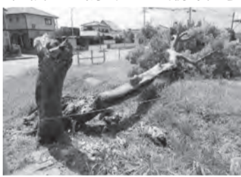
▲今山南登山口で倒れた大木

台風は、夜中より朝にかけて暴風雨を伴って接近しましたが、朝には風も収まり、避難者も帰宅しました。当初は大きな被害はないと思いましたが、後に校区内の大木などが倒れていることが判明しました。被害の詳細は以下の通りです。今山南側登山口にある