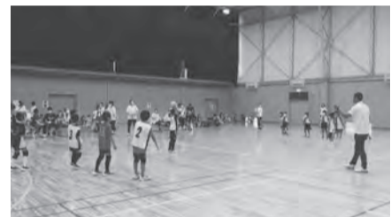
ファインプレーで盛り上がった会場