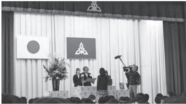
▲今宿小学校卒業証書授与式(テレビに取材されました)

発行所 今宿商工業協同組合 福岡市西区今宿2丁目2番29号 TEL・FAX806-0373 協賛 今宿校区自治協議会・玄洋校区自治協議会 今宿・玄洋校区社会福祉協議会・今宿地区発展期成会 印刷所 松古堂印刷株式会社 毎月1日発行(今宿地区内に戸別配布)