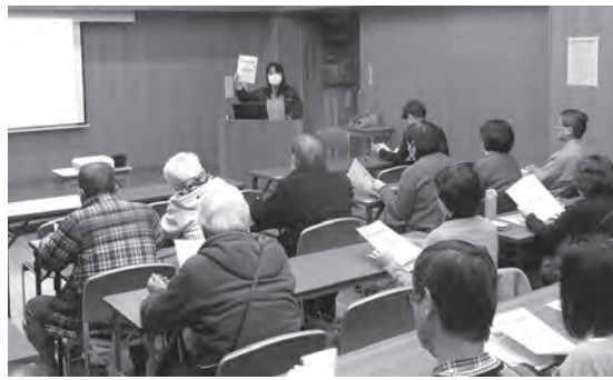
2月25日(火)、玄洋公民館ホールで校区社会福祉協議会主催により、今年度2回目のふれあいネットワーク研修の一環として、『成年後見制度について』と題して、福岡市社会福祉協議会や民生委員さんを中心とした25人の参加者が集まりこの制度について学びました。

2月25日(火)、玄洋公民館ホールで校区社会福祉協議会主催により、今年度2回目のふれあいネットワーク研修の一環として、『成年後見制度について』と題して、福岡市社会福祉協議会や民生委員さんを中心とした25人の参加者が集まりこの制度について学びました。 成年後見制度とは「精神上の障がいによって判断能力が十分でない方を保護する(権利を守る)ための民法で定められた制度」です。判断能力が不十分になり、本来は自分で行うべき財産管理