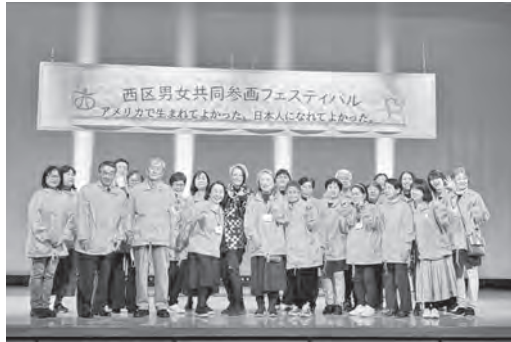
▲ アンさんとすすめる会のみなさん