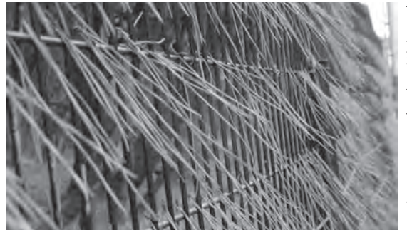
▲メッシュフェンスにマツバの「かやぶき屋根」

冬の晴れた日にウォーキングをしていると、たくさんの野鳥に出会います。特に川辺は渡りで来ているカモやサギをよく見かけます。ため池の上に太陽光パネルが設置されているところで数羽のカワウが集まっています。急いで全員が太陽に向