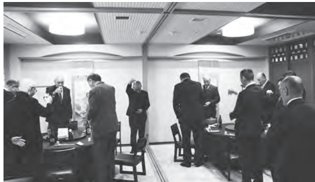
▲各クラスで子ども達の発表を聴く保護者の方々

1月11日今宿分団と今宿・玄洋校区自治協議会、博多手一本にて閉式いたしました。消防団員が減少していき、消防団へ興味のある方は、近くの消防団員もしくは西消防署へご連絡をお願いいたします。