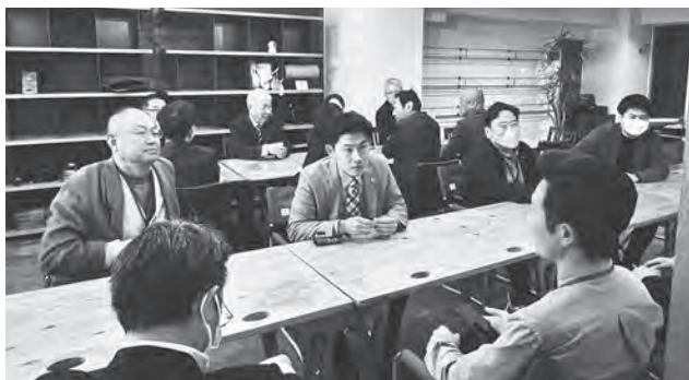
▲熱心に情報交換を行う参加者の方々

2月1日(土)今宿海岸沿いの「SALT」にて、今宿商工業協同組合、周船寺商工連合会、元岡商工連合会、九大学研都市商業連盟、の4団体が情報交換を行いました。当日は各団体の役員と県議・市議の方々が参加。各団体の活動報告や今後の活動予定の発表の場もあり、会の途中で議員に無茶ぶりの質問や