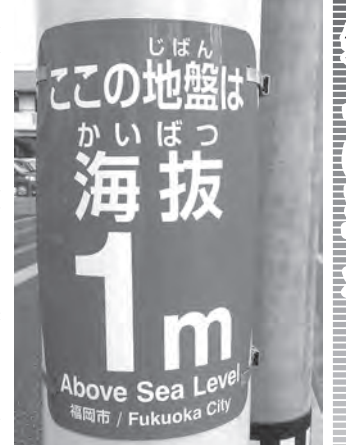
玄洋小学校東交差点付近の海拔1mの表示

今年3月20日は、福岡県西方沖地震より20年です。また、最近猛暑、台風やゲリラ豪雨など異常気象が常態化しています。ところで皆さん、気が付いていませんか。標識柱等に海拔〇〇mと書いてある青い表示板が増えているのをご存知ですか。2月頃より標識柱等に海拔の表示が多くなりました。玄洋公民館付近は4m、今宿駅周辺では3m、そして玄洋小学校東側では1mの海拔が表示されています。西区役所に確認したところ、表示は令和5年度に対象箇所を選定し、主要な幹線道路において、令和6年度に全市一斉に表示設定を行っているとのことでした。海抜は、東京湾の平均海面を減災対策が必要ですね。