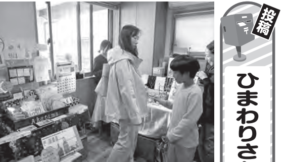
ひまわりさん広場 5月25日、今宿東2丁目にある看護小規模多機能型居宅介護施設「三丁目の花」にて開催された、「ひまわりさん広場」という地域交流イベントに参加してきました。暮らしに役立つ健康講座、に役立つ健康講座、

神主さん(神様)は乗っていません。神主さんが神事をを行い、神輿に御霊入れを行うことで神様が御神樂に移ります。神様が乗った子ども神輿が神社の外にでて、町内を練り歩きます。