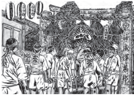
▲ 2003年の夏越祭版画絵