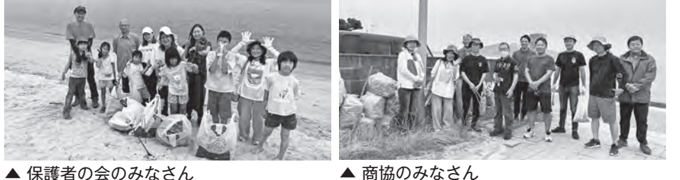
▲保護者の会のみなさん ▲商協のみなさん

保護者の会 福岡市で活動する「IROIROスクール保護者の会」の大人や子ども達がゴミ拾いを行いました。この保護者の会は、フリスボールに通う子どもや、ホームスクーリングを