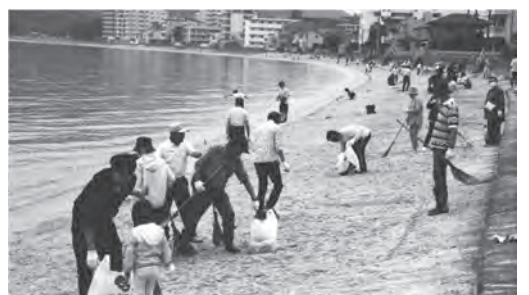
▲今宿海岸で清掃活動をするみなさん

玄洋校区 平成4年に始まったラブアース・クリーンアップ活動は、今年で34回目を迎えました。今年度は、梅雨入りとなった6月8日(日)に行われ、西区の会場は今津長浜海岸でした。玄洋校区では、例年通りには終了しました。