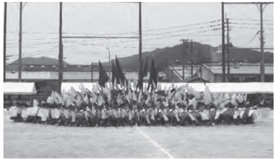
▲『主役は全員』の瞬間!

令和7年5月28日、天候つなぐ真剣な姿に、会場から惜しみない声援が送られ、校体育会が無事に終了しました。また、二人三脚や大成功のうちに幕を閉じました。 今年の体育会スローガンの「主役は全員」がまさに体た。声を掛け合い、息を合 つなぐ真剣な姿に、会場から惜しみない声援が送られました。また、二人三脚や大成功のうちに幕を閉じました。 今年度の体育会スローガンの「主役は全員」がまさに体た。声を掛け合い、息を合 つなぐ真剣な姿に、会場から惜しみない声援が送られました。また、二人三脚や大成功のうちに幕を閉じました。