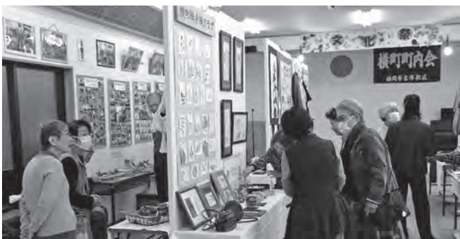
▲ 和気あいあいふれあい楽しい横町町内文化祭

10月8日(土)と9日(日)の2日間、横町町の文化祭が開催されました。町内の数多くの住民が個性豊かな作品を展示し、コーヒー等飲み物も提供されサロンのようにふれあいを深め笑顔溢れる文化祭でした。